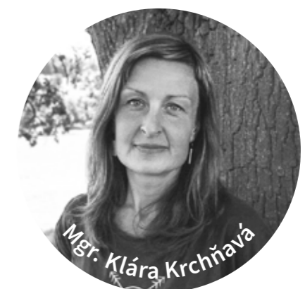
Členka Rady ALMŠ a Skupiny pro kvalitu e-mail: klaker626@gmail.com

Začínala v roce 2004 v Ekologickém právním servisu (nyní Frank Bold) jako organizační ředitelka s péčí o zaměstnance, provoz, PR, fundraising, facilitace. Po čtyřech letech odešla na mateřskou dovolenou a dále pracovala jako manažerka projektu „Sladování rodinného a pracovního života“, v rámci kterého vznikla v roce 2011 nyní již Lesní mateřská škola Sýkorka (první lesní školka v Brně). Protože zájem o docházku do Sýkorky byl veliký, založila v roce 2016 druhou lesní školku – Lesní klub Medlánska.