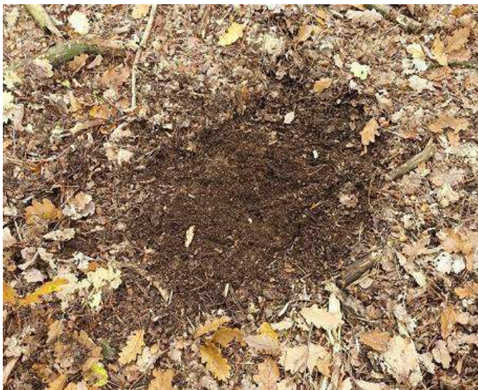
Srnčí spací místo

Srnky ke spaní používají nocoviště na kraji lesa. Zde kopýtky odstraní vrchní vrstvu (listy, větve, humus), aby tím snížili možnosti napadení kožichu a kůže parazity.