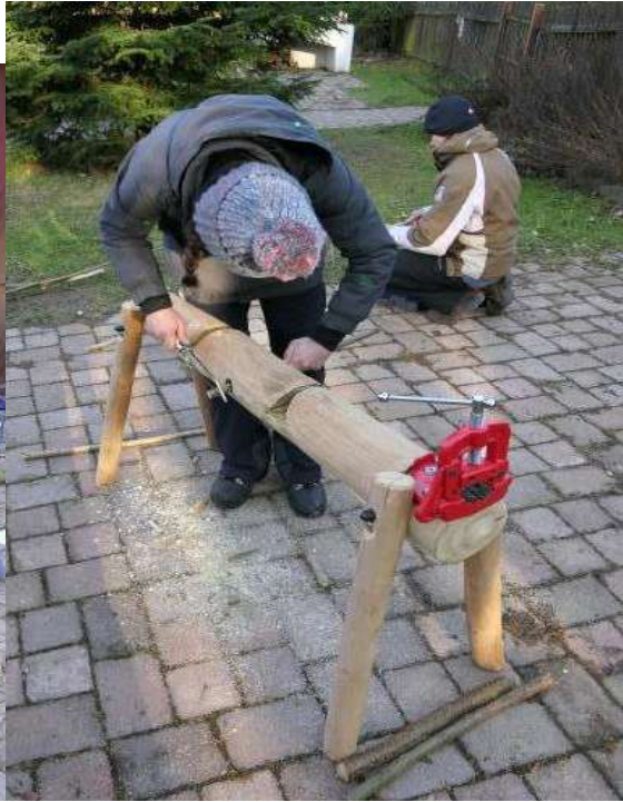
Koza k řezání a napínání