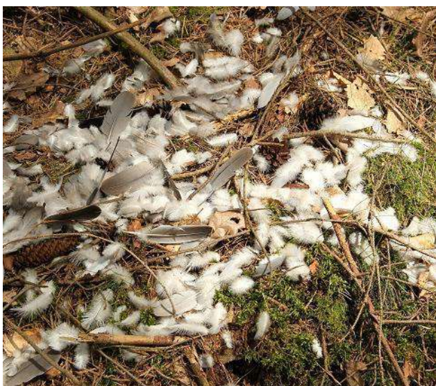
Dravcem oškubané peří

Srnky ke spaní používají nocoviště na kraji lesa. Zde kopýtky odstraní vrchní vrstvu (listy, větve, humus), aby tím snížili možnosti napadení kožichu a kůže parazity.